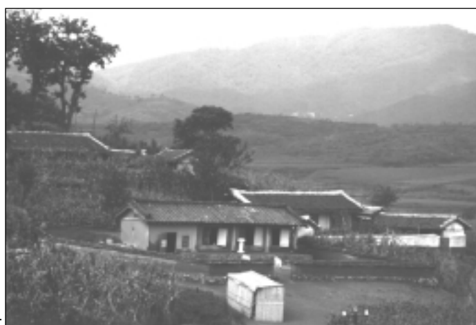
Родной дом Отца

В семье Отца было 13 детей, пятеро из них умерли в детстве.