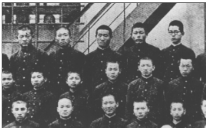
По окончании школы

2.1941 г.----Окончание Практической школы торговли и промышленности в городе Сеуле.